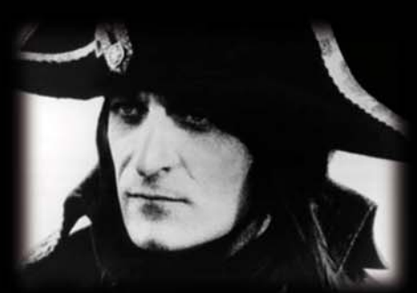
Masterisation du Napoléon d'Abel Gance de 1927 effectuée par Vectracom pour la Cinémathèque Française