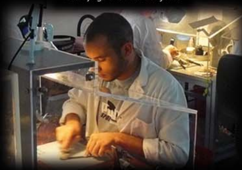
Nettoyage manuel des films